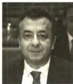
Ο υφυπουργός Οικονομίας, Ανταγωνιστικότητας και Ναυτιλίας, Σταύρος Αρναουτάκης.

τα κράτη μέλη καθώς και στην αποτελεσματικότερη λειτουργία της εσωτερικής αγοράς. Στην παρέμβασή του, ο υφυπουργός κ. Αρναουτάκης τόνισε ότι η Ελλάδα δεν είναι διατεθειμένη να μειώσει το επίπεδο προστασίας των Ελλήνων καταναλωτών και ότι η πρόταση οδηγίας αποτελεί ένα σημαντικό εγχείρημα το οποίο όμως πρέπει να τύχει μεγαλύτερης επεξεργασίας, ώστε να επιτυγχάνει καλύτερα τους στόχους του. Το Συμβούλιο Ανταγωνιστικότητας υιοθέτησε